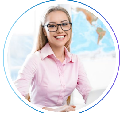
менеджер по туризму