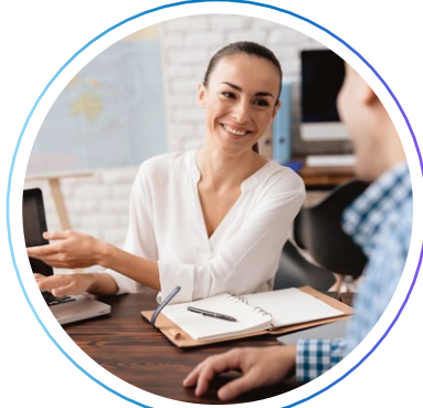
помощник менеджера по туризму (туры по России)